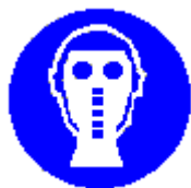
Protezione obbligatoria delle vie respiratorie