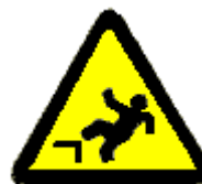
Caduta con dislivello