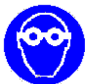
Protezione obbligatoria degli occhi