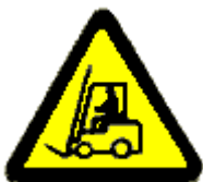
Carrelli di Movimentazione