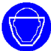
Protezione obbligatoria del viso