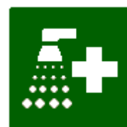
Doccia di sicurezza