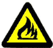
Materiale infiammabile o alta temperatura