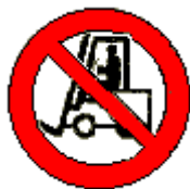
Vietato ai carrelli di movimentazione