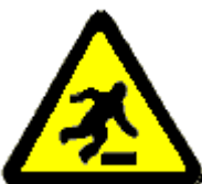
Pericolo di inciampo