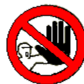
Divieto di accesso alle persone non autorizzate