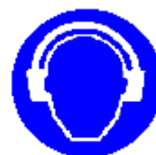
Protezione obbligatoria dell'udito