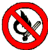
Vietato fumare o usare fiamme libere