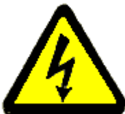
Tensione elettrica pericolosa