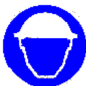
Casco di protezione obbligatoria