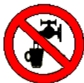
Acqua non potabile