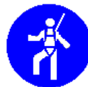
Protezione individuale obbligatoria contro le cadute