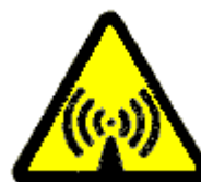
Radiazioni non ionizzanti