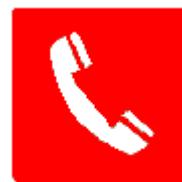
Telefono per gli interventi antincendio