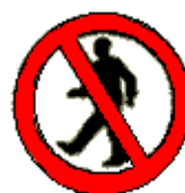
Vietato ai pedoni