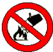
Divieto di spegnere con acqua