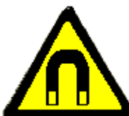
Campo magnetico intenso