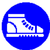
Calzature di sicurezza obbligatoria