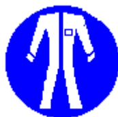
Protezione obbligatoria del corpo