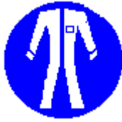
Protezione obbligatoria del corpo