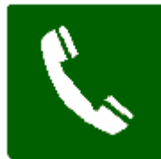
Telefono per salvataggio