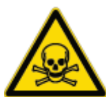
Pericolo Sostanze Tossiche