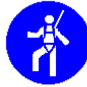
Protezione individuale obbligatoria contro le cadute