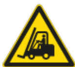
Pericolo Carrelli Elevatori ed altri veicoli

Uffici, aule atri, corridoi, scale, luoghi di transito in genere non presentano, per gli operatori dell'Appaltatore, rischi specifici in relazione alle attività svolte dal personale universitario, studenti e soggetti ad essi equiparati.