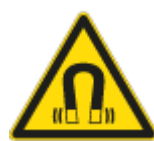
Pericolo Campo Magnetico