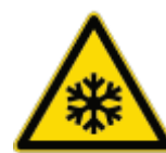
Pericolo Bassa Temperatura