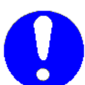
Obbligo generico (con eventuale cartello supplementare)