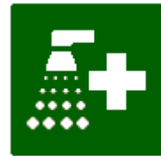
Doccia di sicurezza