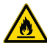
Pericolo Materiale Infiammabile