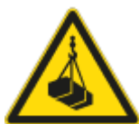
Pericolo Carichi Sospesi

Sono presenti pericoli connessi alla possibilità di transito o stazionamento di personale universitario, studenti, soggetti ad essi equiparati, pubblico in genere in concomitanza con il passaggio di veicoli o attrezzature (carrelli elevatori, autoveicoli, autocarri, ecc.); i relativi rischi sono l'investimento di persone, la caduta di carichi su persone transiti durante le operazioni di carico e scarico di materiali.