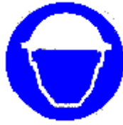
Casco di protezione obbligatoria