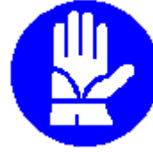
Guanti di protezione obbligatori