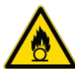
Pericolo Sostanze Comburenti