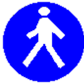
Passaggio obbligatorio per i pedoni