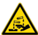
Pericolo Sostanze Corrosive