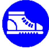
Calzature di sicurezza obbligatoria