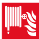
Lancia Antincendio O Naspo