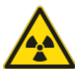
Pericolo Radiazioni Ionizzanti