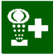
Lavaggio per occhi e pronto soccorso