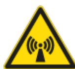
Pericolo Radiazioni Non Ionizzanti