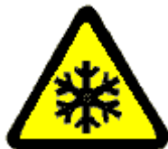
Bassa temperatura o irritanti