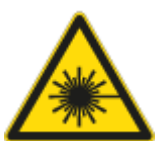
Pericolo Raggio Laser