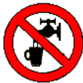
Acqua non potabile