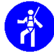
Protezione individuale obbligatoria contro le cadute