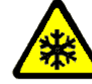
Bassa temperatura o irritanti