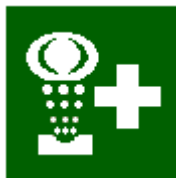
Lavaggio per occhi e pronto soccorso