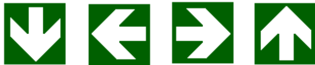
Direzione da seguire (Segnali di informazione aggiuntivi ai pannelli che seguono)