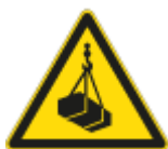
Pericolo Carichi Sospesi

Sono presenti pericoli connessi alla possibilità di transito o stazionamento di personale universitario, studenti, soggetti ad essi equiparati, pubblico in genere in concomitanza con il passaggio di veicoli o attrezzature (carrelli elevatori, autoveicoli, autocarri, ecc.); i relativi rischi sono l'investimento di persone, la caduta di carichi su persone transiti durante le operazioni di carico e scarico di materiali.