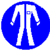
Protezione obbligatoria del corpo