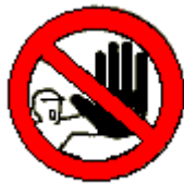
Divieto di accesso alle persone non autorizzate