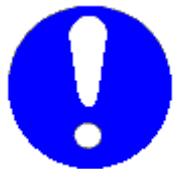
Obbligo generico (con eventuale cartello supplementare)